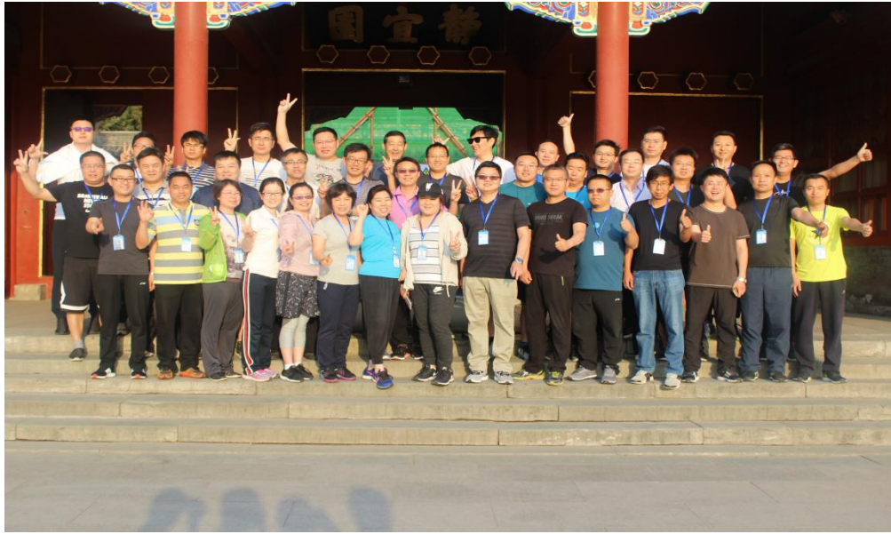
碧水源之鹰翱翔计划暨管理干部特训营第三期合影