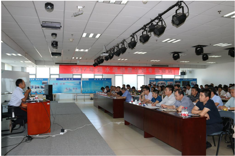
2017年经营计划专题培训