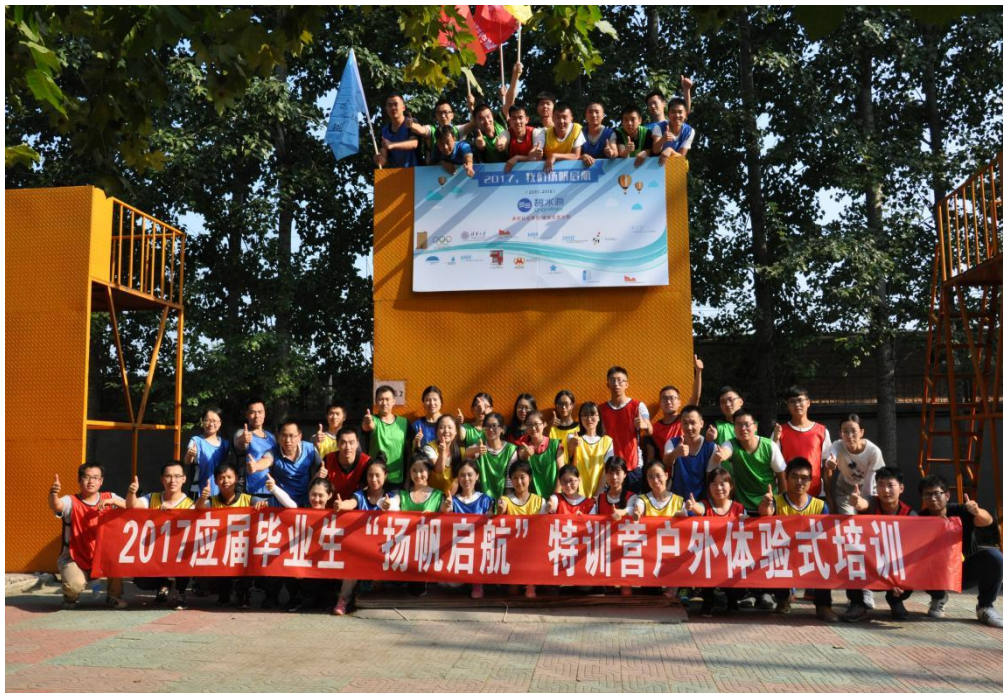
2017 应届生“扬帆启航”特训营合影